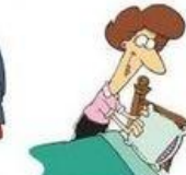
Faire le lit