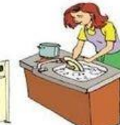
Faire la vaisselle