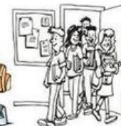
Sortir de l'école