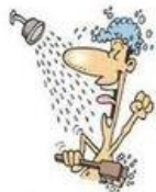
Prendre une douche