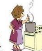
Faire la cuisine