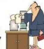
Préparer le petit Déjeuner