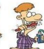
Se brosser les dents