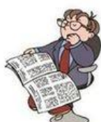
Lire le journal