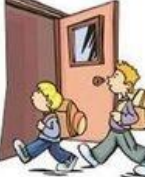
Arriver à l'école