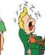
Faire une sieste