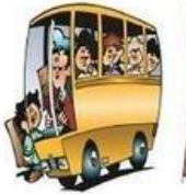
Aller à l'école