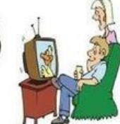
Regarder la télévision