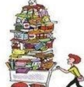
Faire des courses