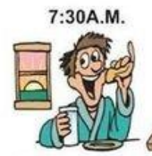
7:30 A.M. Prendre le petit Déjeuner