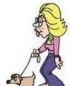
Sortir le chien