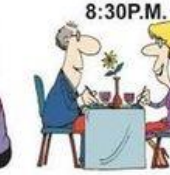
8:30 P.M. Dîner