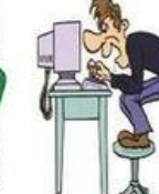
Surfer sur le web