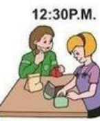
12:30 P.M. Déjeuner