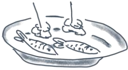
un hors- d'oeuvre