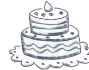
du gâteau du gâteau