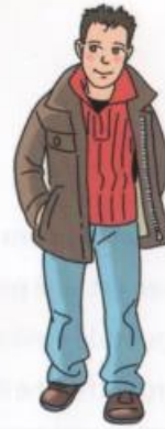
Matéo : il a 13 ans. Il va tout faire pour retrouver son chien.